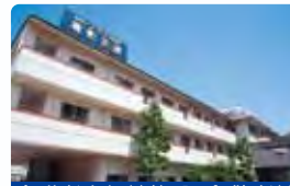
介護老人保健施設 倉敷老健