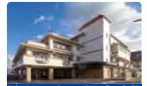
複合型介護施設 ピースガーデン倉敷