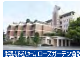
住宅型有料老人ホーム ローズガーデン倉敷