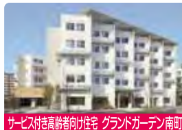
サービス付き高齢者向け住宅 グランドガーデン南町