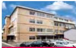
倉敷在宅総合ケアセンター