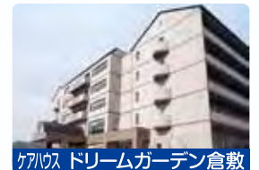
ケアハウス ドリームガーデン倉敷