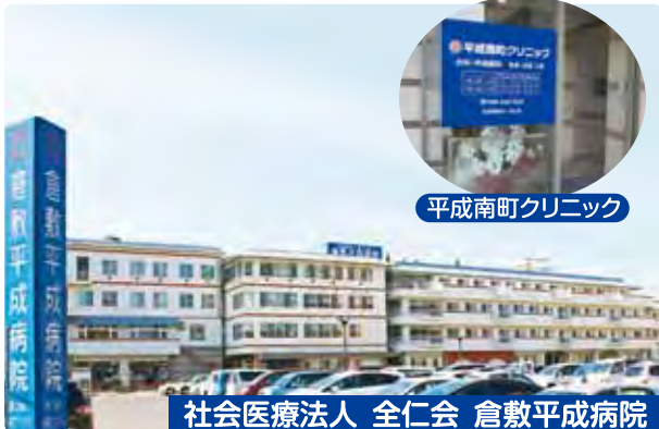
平成南町クリニック

※全仁会グループは倉敷平成病院を中心とする社会医療法人全仁会、社会福祉法人全仁会、有限会社医療福祉研究所ヘイセイの3法人で構成されています。