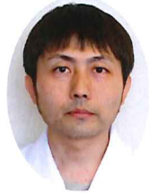
社会医療法人全仁会倉敷平成病院 脳卒中内科部長