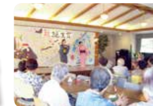
お誕生会(多目的ホール)