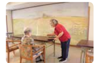
食事の配下膳(自費)